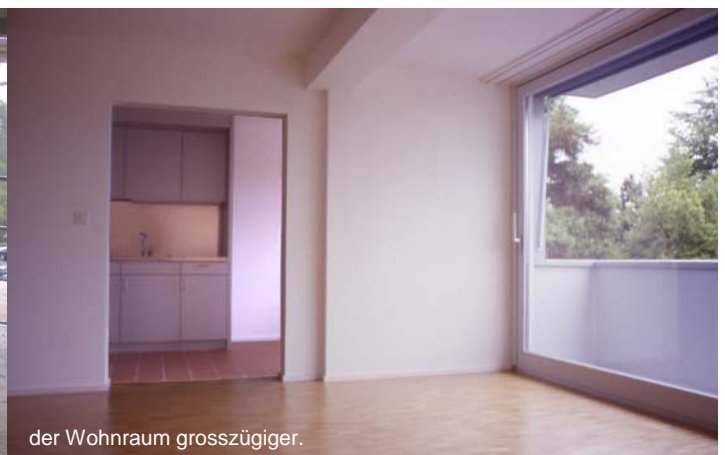
der Wohnraum grosszügiger.