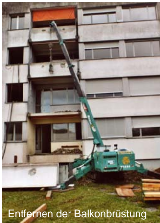
Entfernen der Balkonbrüstung