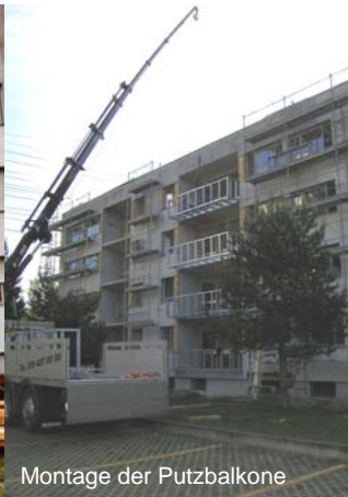
Montage der Putzbalkone