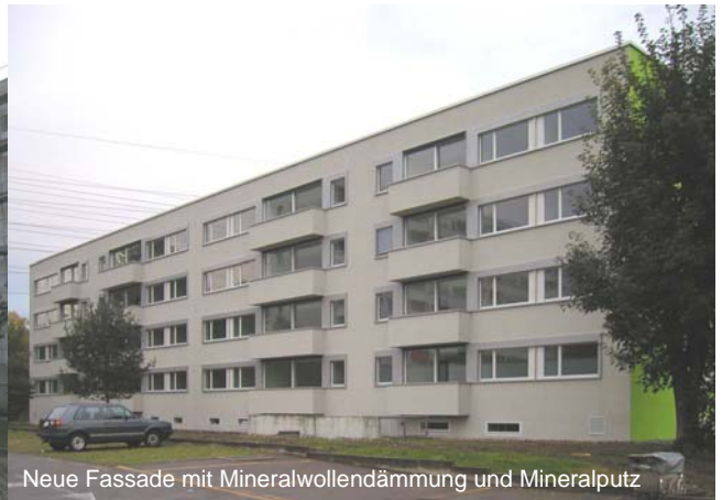
Neue Fassade mit Mineralwollendämmung und Mineralputz

In nur 6 Monaten wird eine Wohnüberbauung vollständig erneuert.