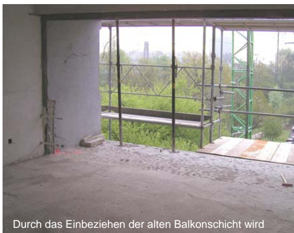
Durch das Einbeziehen der alten Balkonschicht wird