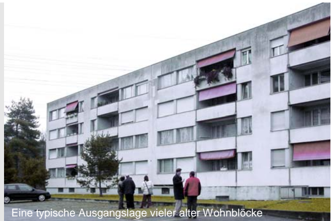
Eine typische Ausgangslage vieler alter Wohnblöcke